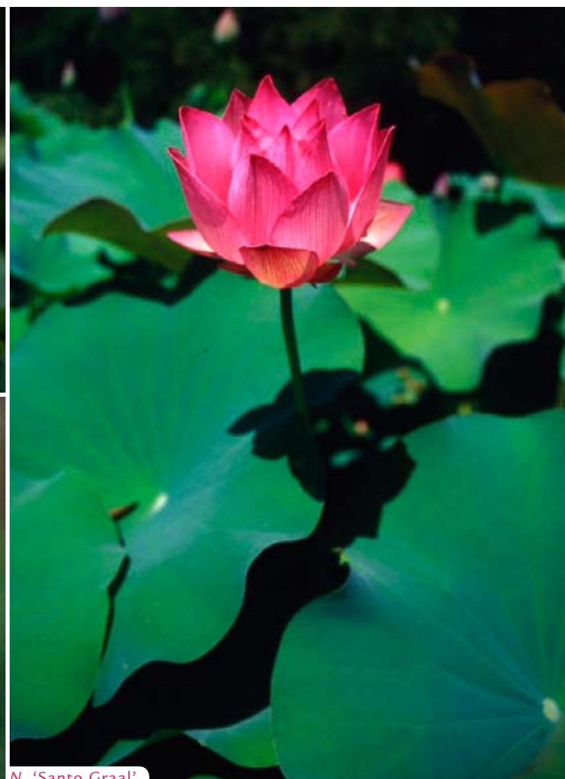
N. 'Santo Graal'