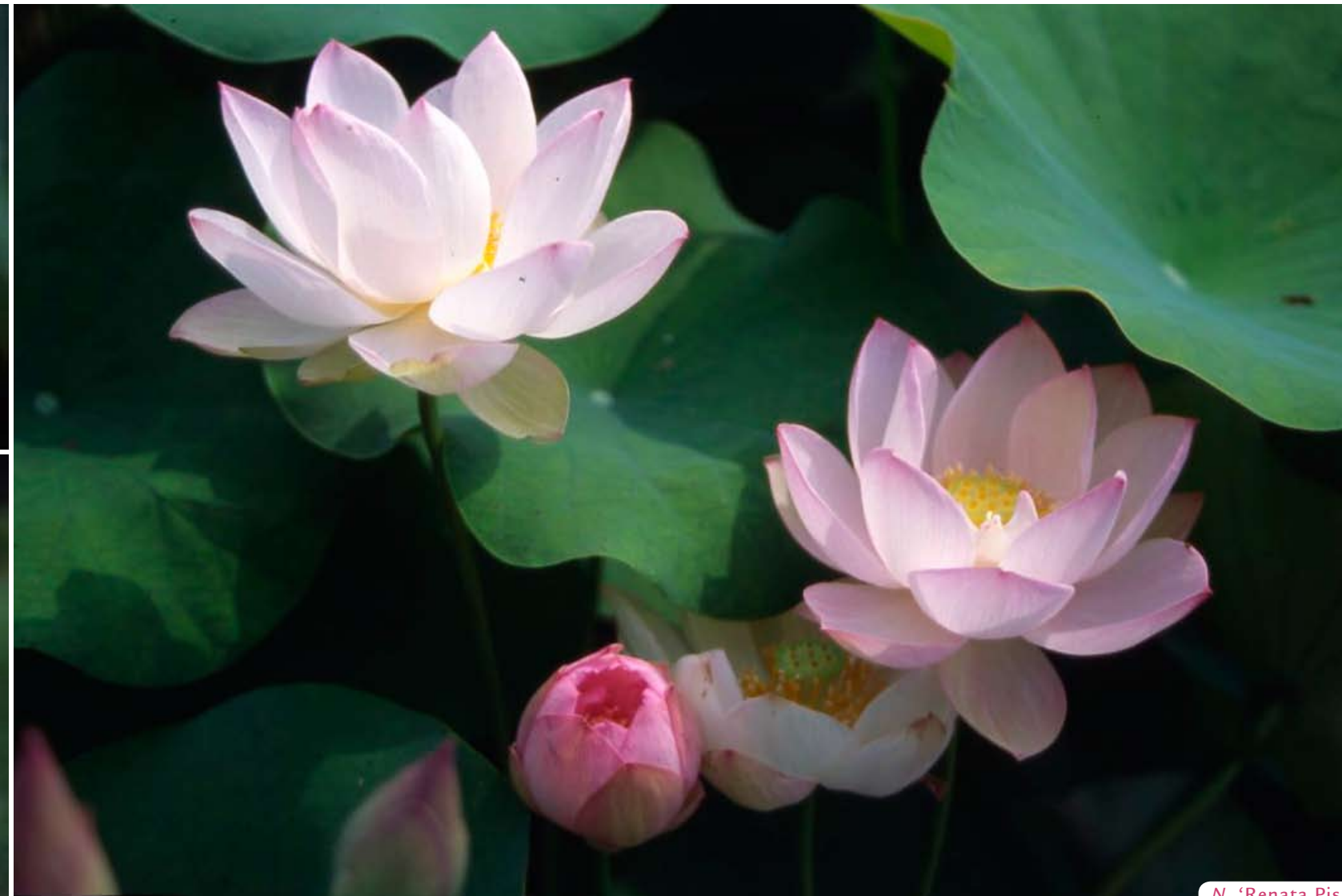
N. 'Renata Pisu'