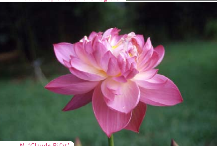
N. 'Claude Rifat'