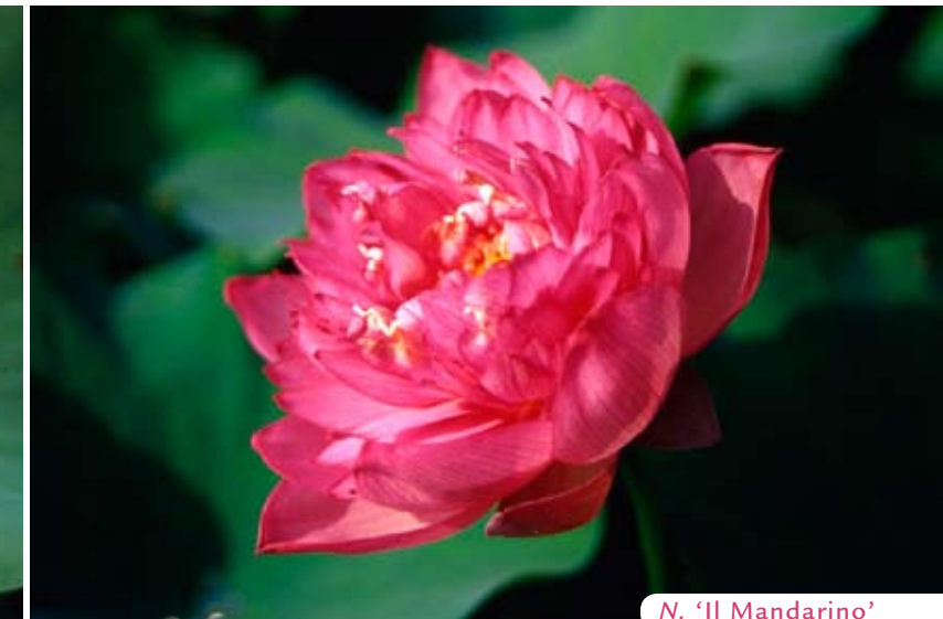
N. 'Il Mandarino'